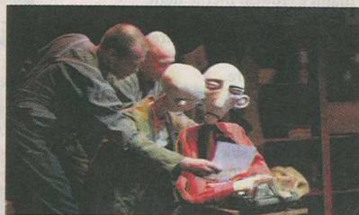
MANUSKRIFT: Hovedpersonen forsøker å selge et manuskript til en avisredaktør.

Det er imponerende og se på de to dukkeføernes utrolige koordinasjon, men det slår en samtidig at med enda flere forestillinger bak seg, ville det hele trolig ha forløpt enda smoothere.